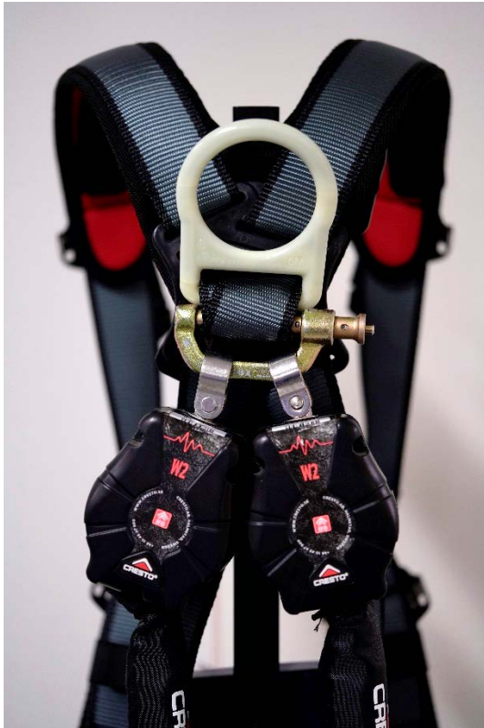
Bild 2, Block med karbin.